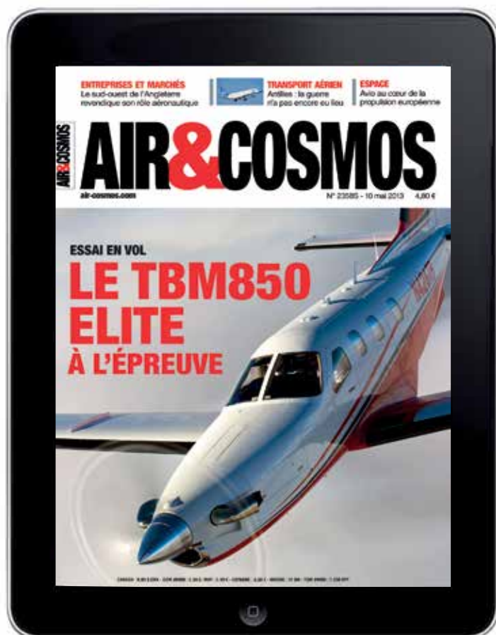
Avec votre iPad