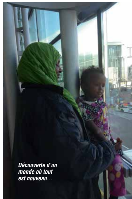
Découverte d'un monde où tout est nouveau...

En 2012, 33 groupes de réfugiés convoyés principalement vers les USA, le Canada et l'Europe du Nord. 752 réfugiés ont déjà été pris en charge par 23 convoyeurs bénévoles sur les cinq premiers mois de 2013. La durée moyenne d'une mission est de cinq jours.