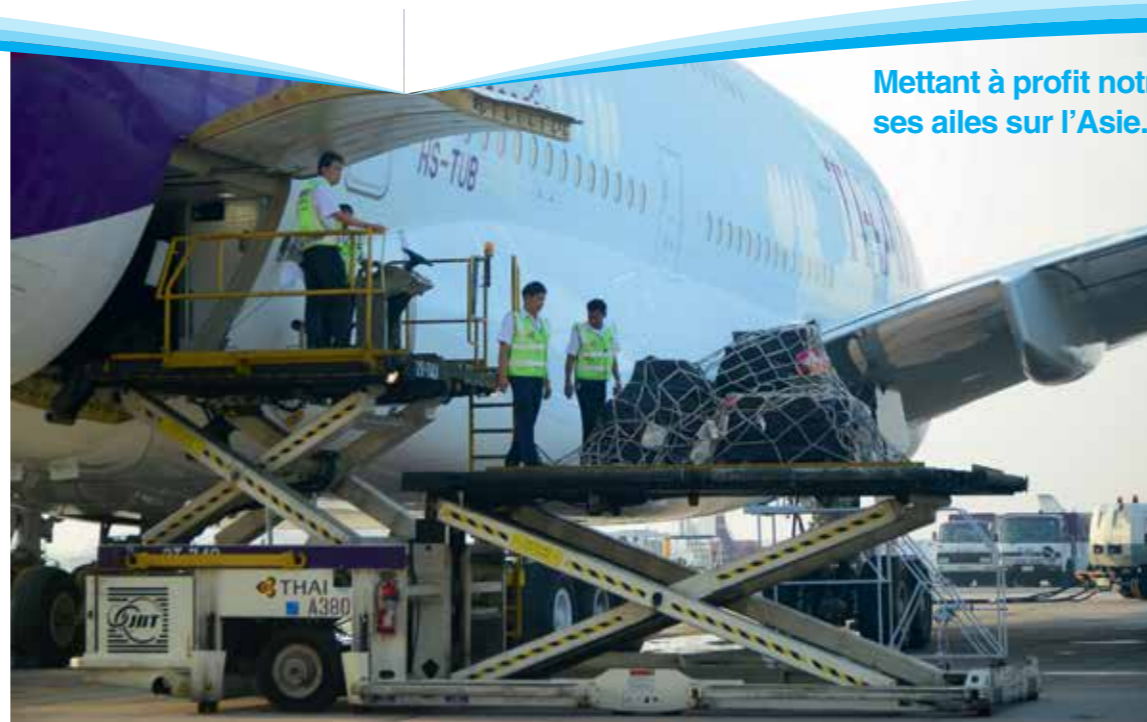
Mettant à profit notre coopération avec la Fondation Airbus, ASF étend ses ailes sur l'Asie. Cette fois, avec l'aide de la compagnie Thai Airways .

Ce numéro, envoyé dans une enveloppe fermée, comporte un encart jeté d'une page et pour partie des abonnés un encart jeté « bon de soutien régulier »