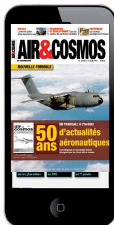
Avec votre iPhone