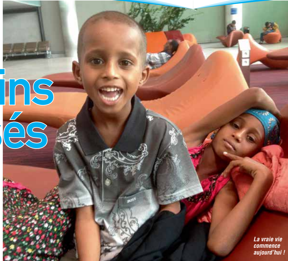
La vraie vie commence aujourd'hui !

Après plusieurs mois, années (?) l'occasion de se faire la belle se présente enfin. Il va désertier cette armée pour laquelle il est obligé de livrer des combats qui ne le concernent pas. Son salut